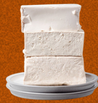
QUESO DE TOFU