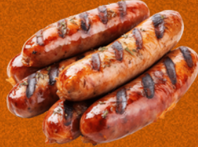
SALCHICHAS DE SOYA NON GMO