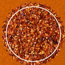
HOJUELAS DE CHILE