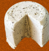
QUESO DE MARAÑÓN