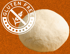
GLUTEN FREE Q.82